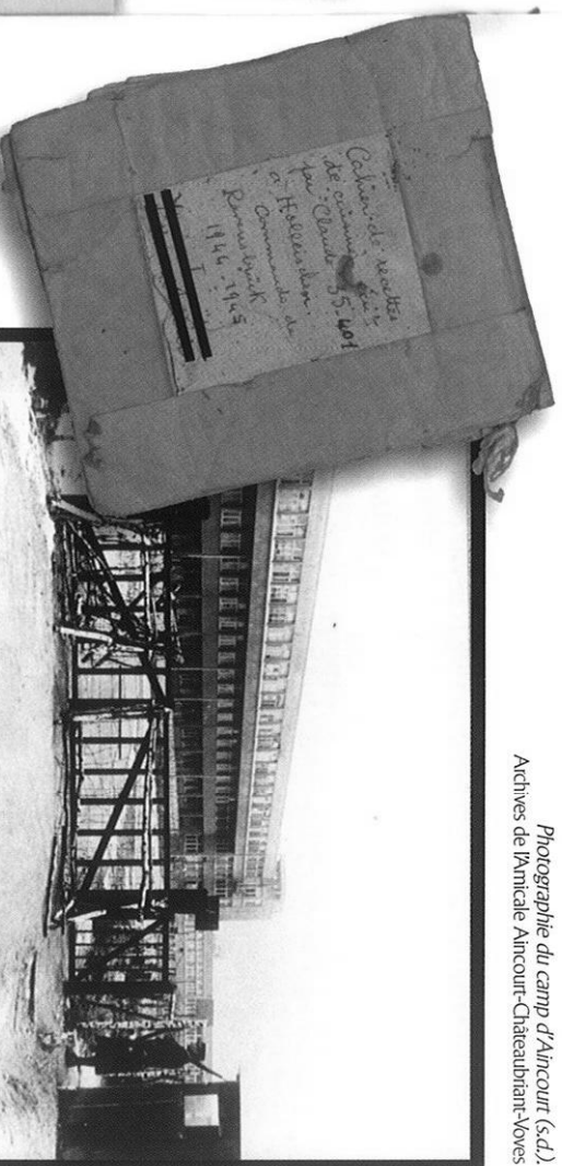
Photographie du camp d'Aincourt (s.d.)

Cahier de recettes fabriqué par une déportée dans un Kommando de Ravensbrück, 1944-1945.