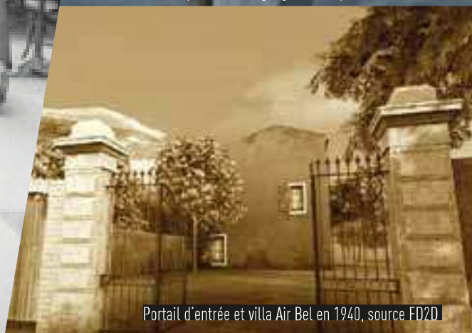
Portail d'entrée et villa Air Bel en 1940