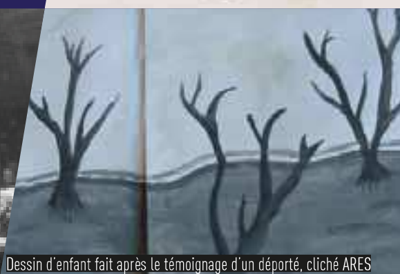
Dessin d'enfant fait après le témoignage d'un déporté