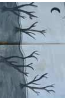
Dessin d'enfant fait après le témoignage d'un déporté, cité à ARES

Comment l'exil oblige-t-il à penser la culture d'aide et la responsabilité ? L'exil ne touche pas seulement les personnes, certaines formes de la culture sont sabotées ou transformées. Pourquoi ? Comment ? Et enfin comment vivre l'exil et son devenir dans la mémoire ? Telles sont les questions posées au cours de cette journée.