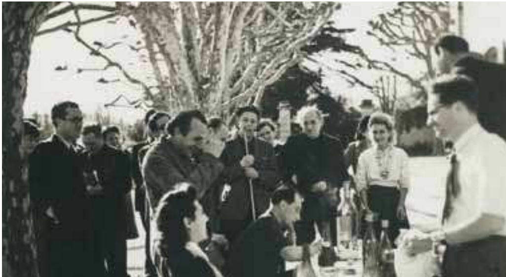
Vente aux enchères à la Villa Air Bel en 1941, collection Pierre Ungemach.