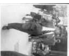
Gilberto Bosques, consul général du Mexique en 1940

Pendant la Seconde Guerre mondiale, les étrangers antiras-cistes, antnazis et républicains pourchassés par les dictatures furent très nombreux à Marseille. Plusieurs témoignages et communications universitaires, un film et une exposition permettront d'évoquer la diversité de leurs situations et de leurs engagements dans la Résistance. Une place particulière sera accordée à l'action de Gilberto Bosques, Consul du Mexique, qui sauva et fit partir vers son pays des centaines de républicains espagnols et d'indésirables