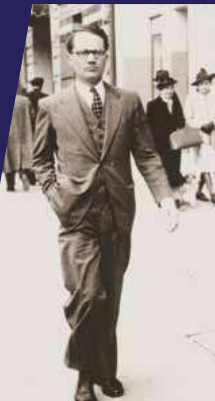
Varian Fry sur la Canebière en 1940