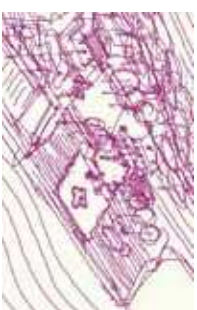
Schéma de la villa, ENSA, Marseille.

Cette journée sur la « Villa Air-Bel, années 40 » restitue ce lieu de répit et de création des intellectuels et artistes surréalistes sous la protection du Centre Américain de Secours animé par Varian Fry. La recherche menée pendant quatre ans sur ces lieux disparus a permis de reconstituer le quotidien de ces candidats à l'exil et de découvrir virtuellement le Parc Air-Bel. Les tables rondes et l'exposition complètent les portraits des « surréalistes sous contrôle » et interrogent l'héritage des valeurs, laissé aujourd'hui par ce pan d'histoire exceptionnel de Marseille.